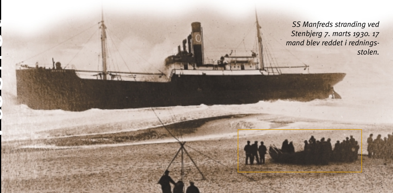
SS Manfreds strandning ved Stenbjerg 7. marts 1930. 17 mand blev reddet i redningsstolen.

Det nørrejske Redningsvæsen blev oprettet i 1852, og der blev da opført 21 redningsstationer langs den jyske vestkyst. Den stærke strøm, de hyppige storme og revlerne fik mange skibe til at strande, og selv når strandingerne skete ganske tæt på kysten, var de skibbrudne sjældent i stand til at komme helskindet i land ved egen hjælp.